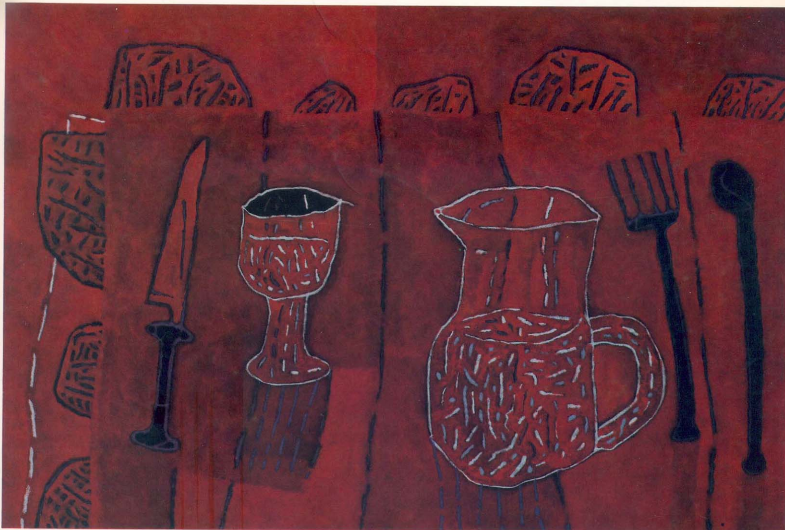
Vaso y jarra 1991 Esmalte, óxido y óleo sobre tela 120 x 180 cm