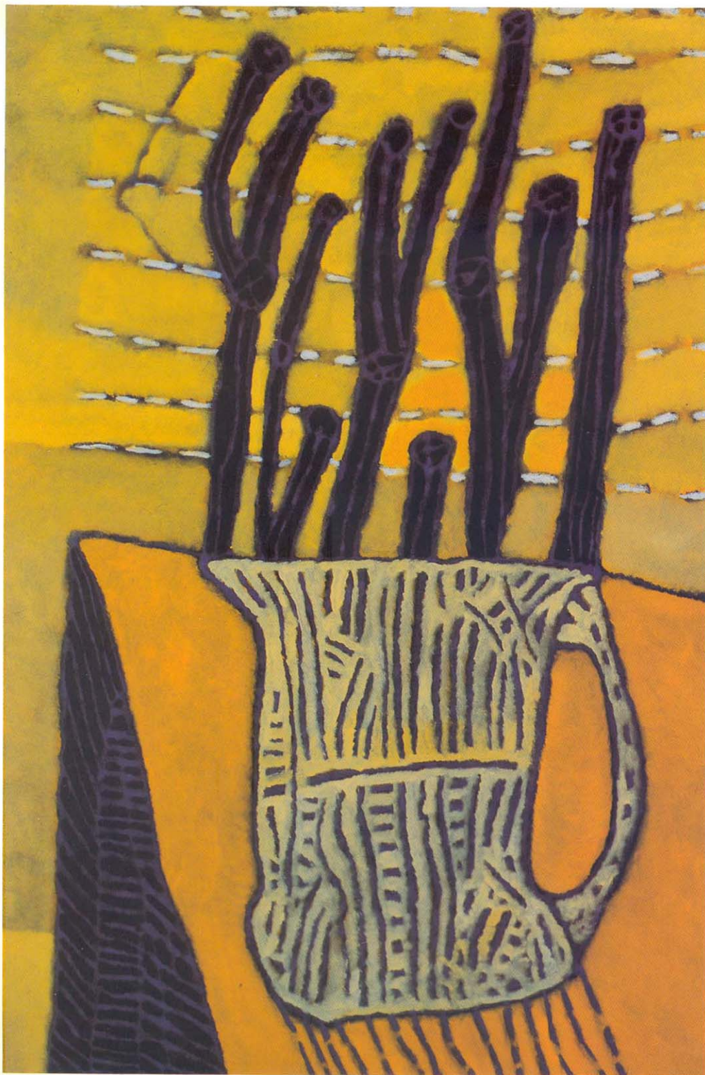
Flores negras 1991 Esmalte, óxido y óleo sobre tela 120 x 80 cm

Fotografías color Gabriel Reig Fotografía del artista Esoo Alvarez ISBN- 980-6197-25-9